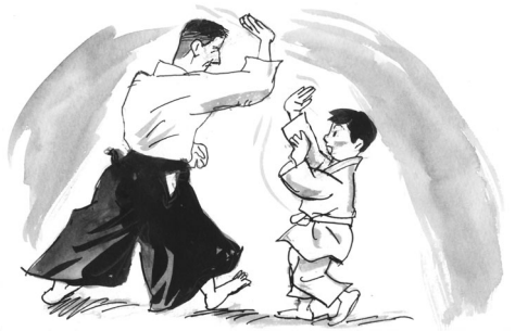
イラスト 斎藤 融

先日息子の稽古している合気道の演武会があった。息子の相手は道場の先生だった。とても背の高い先生は手加減もせず、真正面から息子の脳天めがけて目にも止まらない速さで手刀を振り下ろしてくる。もし当たったら死んでしまうほどの威力に思わず身がすくんだ。ところがまさにその瞬間、息子に電流が走ったかのように先生の「気」が流れ込み、息子はその流れに乗るようにして先生をかわし、投げる。そんな演武をしている息子からとめどなく生命力が湧き上がってくるのを感じた。大人の「本気」が子供を極限の精神状態に導き、閉じ込められた生命力を解き放った瞬間。そこには一つ一つの激しい動作とは裏腹な、穏やかで限りなく静かな世界を感じた。