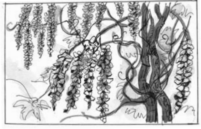
イラスト 齋藤 融

この季節は毎年恒例で上発地地区の婦人部でお花見にでかけることになっている。たいてい電車や車を利用しての小旅行なのだが、今年は趣向を変え、徒歩でお隣の下発地地区のお寺にフジを見に行くことになった。