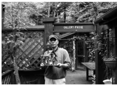
ギャラリー-FH116(10時~17時営業 不定休) 千ヶ滝西区2568・旧あやめが原バス停隣 TEL:0267-45-0164

千ヶ滝西区から大日向方面に抜ける、別荘地の道路沿い・旧あやめが原バス停そばに2568 YAZAMAYA という案内板。専用駐車場に車を置いて、階段を下りて行くと「FH116」という、とてもメルヘンチックなギャラリー&ショップ