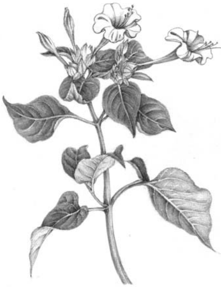
画 三笠パーク 布川 静

軽井沢ニュース舎 Karuizawa News http://www.karuizawa-news.org