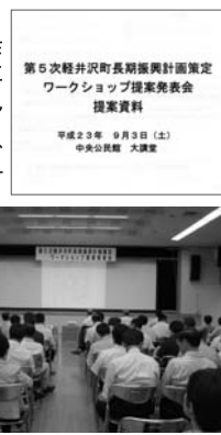
第五次軽井沢町長期振興計画策定ワークショップ提案発表会 提案資料

九月三日(土) 十三時中央公民館 第五次・軽井沢町長期振興計画策定「ワークショップ提案発表会」開催