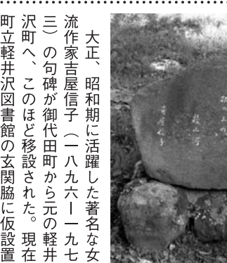
大正、昭和期に活躍した著名な女流作家吉屋信子(一八九六-一九七三)の句碑が御代田町から元軽井沢町へ、このほど移設された。現在、町立軽井沢図書館の玄関脇に仮設置してある(写真)。