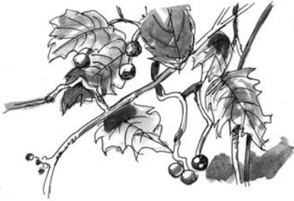
イラスト 斎藤 融

森を包んでいた濃い緑が次第に色褪せてきた。澄んだ青空が木々の 間から顔を覗かせ、赤い実や薄茶色の果穂と何やら囁きあっている。 森に響いていた夏の音色も気がつくときすっかり秋めき、祭りの気分を 漂わせている。色と音... そこには切ってもきれない関係がある。