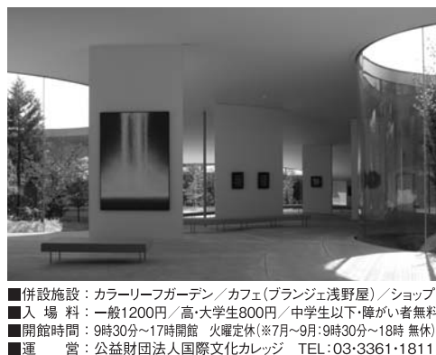
併設施設: カラーリーフガーデン/カフェ(プランジ浅野屋)/ショップ 入場料: 一般1200円/高・大学生800円/中学生以下・障がい者無料