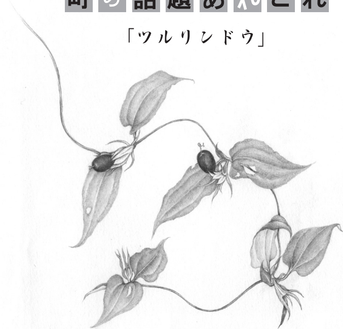
画 三笠パーク 布川 静

軽井沢ニュース舎 Karuizawa News http://www.karuizawa-news.org