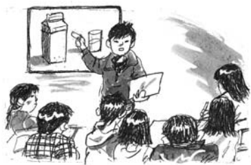
イラスト 齋藤 融

斬新な教育現場を見た。長野市飯綱高原にあるグリーン・ヒルズ中学校だ。 子どもたちの個性と人間性を尊重し、自分で考え、自分で学び、自分の人生を自ら選び取る自立した人を育てる学校。