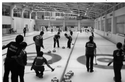
この大会の優勝チームは、来年1月27日から韓国で開催される第8回パシフィックジュニア選手権の出場権を獲得できるため、全国から集まった男女各8チームが12月4日までの5日間にわたって熱戦を繰り広げた。(※参加資格は平成23年6月30日現在で21歳未満の者)

十一月三十日(水) 開会式・予選 第20回 全農 日本ジュニアカーリング選手権大会が、風越公園・スカッポ軽井沢で開催された。