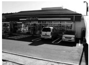
リゾートマーケット ヤオトク 0267・45・4819 代版御用聞き

軽井沢駅近く国道18号沿いの別荘族相手のスーパーヤオトクが、既存店のスーパーと新規店のコンビニがコラボ(共同)するリゾートマーケットヤオトクとファミリーマーケットヤオトク軽井沢店としてリニューアルオープン(写真)。全国チェーンストアのファミリーマーケットは軽井沢での町1号店。スーパーとコンビニがコラボする試みは日本初業態といわれ、軽井沢が初登場。新装開店から4カ月、同業者たちの熱い視線が集まる。