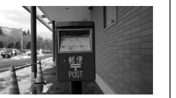
以前から郵便ポスト設置の希望が多かった、バイパス鳥井原東信号際のツルヤ軽井沢店に、地元民ほかいろいろなたちの尽力と、藤巻町長の応援もあって実現。1月12日から使用が開始されている。◆取集時刻は平日・土・休日とも14時ごろ。

1月中旬~ツルヤ軽井沢店に 郵便ポストが設置されました。場所は、北側出入口です。