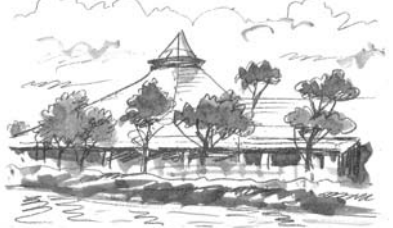
イラスト 齋藤 融

震災から一年が過ぎた。その間に私が学んだことは「今こそ自分が本当にやりたいと思うことを、ほかに頼らずから自分の手で作る」ということだ。