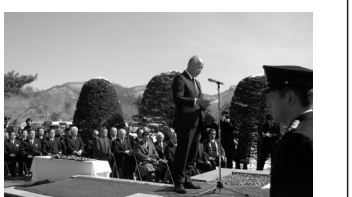
40年前の2月19日から10日間、連日マイナス19℃の厳寒のなか、南軽井沢で起きた連合赤軍の「あさま山荘」事件の人質救出作戦で、殉職された警察官の慰霊祭が、ご遺族と関係者多数が参列して行われた。

2月28日 南軽井沢・治安の碑で あさま山荘事件40周年の慰霊式 殉職警察官の冥福を祈って献花。