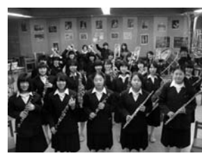
毎年恒例の「春のコンサート」を行います。今年のテーマは「絆...そしてはじまり」。

【演】軽井沢中学校吹奏楽部 さくららのうた、希望の星/キャンディーズメドレーほか