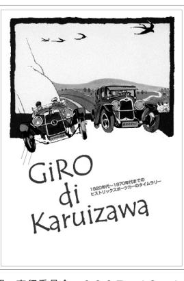
問 実行委員会 0267・42・4271

五月二六・二七日(土日)に開催...新緑の軽井沢を走り抜ける...第11回ジロ・デ・軽井沢「走る!自動車博物館」のエントリーが始まる!