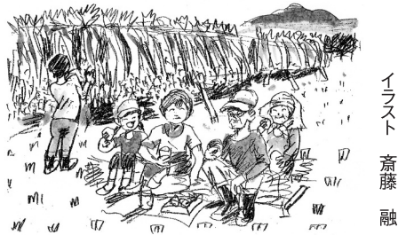
イラスト 齋藤 融

実った稲。それを目の前にしてこれから収穫しようとするとき、不思議と私の1年の実りのすべてを稲に引きだされる感じがする。