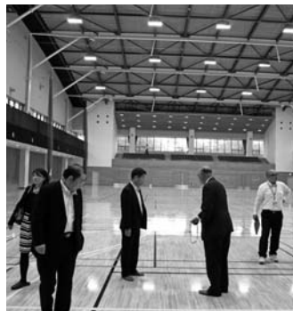
待っただけのこはあつた...素晴らしい出来上がり...と土屋委員長

■七月一日(火) 軽井沢風越公園総合体育館がオープン。町議会・風越公園整備事業特別委員会が6月11日の本会議終了後、視察を行った。 本年3月25日竣工、4月1日オープンの予定だった社会資本交付金事業・風越公園総合体育館は、諸般の事情により4月25日に延期され、2月15日の大雪/豪雪などのために再度延長、町民から供用開始を待たれていたが、7月1日にオープンする。営業時間などの詳細については、広報かるいざわ7月号に掲載される予定だが、予約受付は始まっている。(スカップ軽井沢48・2145) 待ちかねた町議会・特別委員会も6月11日、本会議終了後に視察会を実施、新体育館の出来栄を見学。