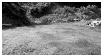
天然芝のハワイアンフラコート