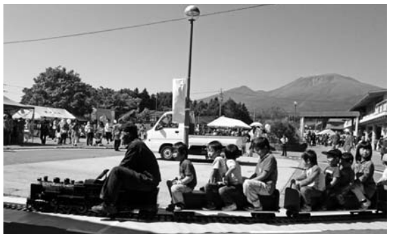
■ミニSLコーナー/スタンパリー/ビンゴ/朗読体験/野菜販売/豚汁&いなり寿司/ソフトクリームなども。

■9月28日(日) 10時～14時 第10回ふれあい祭りが、みんな笑顔で10年目。今年のステージも楽しさいっぱい！と中央公民館ほかで開催。