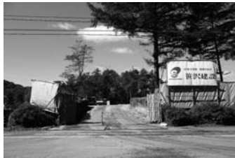
指定地域における太陽光発電施設の設置について、現行の協議対象土地利用行為の計画が、町の自然保護対策基準に適合するかどうかで、町との間で協議が進行中だ。

馬取だより 女街道・みなみかるいざわ敬老園の隣に「土屋靴工房とシヨップ」が、来年5月に完成・オープンか？