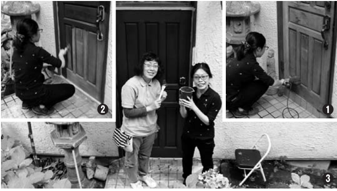
■本紙7月号(第131号)で募集した「ペイントモニター」の実践編をご紹介します。

自宅の木製ドアが古くなって傷んでいたの、自分で塗り替える行いました。皆さんもDIYで気軽にリフォームをしてみませんか。必要なものはサンダー、マスク、ハケとカットマスカー、屋外用木材塗料のガードラックアクアです。手順は①サンダーでの研削作業から。古い塗料が残っていると新しい塗料と一緒に剥がれてしまうので丁寧に研削します。②サンダーの当たらない場所には、金ブラシやサンドペーパーを使います。③次に、塗料をつけたグレーブやマスカーで覆います。④最後にガードラックアクアを塗り、装いたら完成です。塗料のコツは使用前に缶をよく振る使用、塗料をハケにつけ過ぎないこと、木目に沿って塗装することです。ガードラックアクアは1回塗りで優れた着色力があるので、ウツドデッキや木造外壁などのメンテナンスに最適な塗料です。防虫、防腐、防カビ成分をマイクロカプセル化しており、薬剤効果が持続します。また、直接薬剤に触れることがないので安心してお使いいただけます。◆塗料や塗装でお困りの際は、和信化学工業株式会社/お客様センター 10748・53・1966までお気軽にお電話ください。