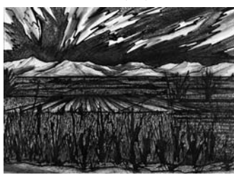
「信州風景」1956年、鉛筆、墨、紙