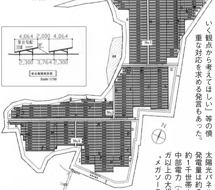
モジュール配置図

同審議会は9月にも開催、2回目の10月は委員が現地視察を終えた後、協議した。各委員から「過去において」利用価値が低かった場所。景観、美観の問題は生じない」「地元が代々苦勞してきたこととは分ける」「太陽光発電施設の設置基準に合致すれば