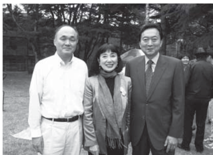
鳩山由紀夫氏ご夫妻と友愛山荘にて