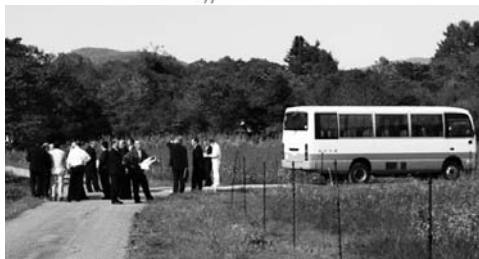
同審議会は計画の賛否を多数決で採り、正副委員長らを除く委員11人のうち賛成8人、反対2人、保留1人だった。町生活環境課はこの結果を受け、計画を認める答申案をまとめた。賛成意見だけでなく反対意見も事業者側に伝えることを約束した

【太陽光発電施設概要メモ】 設置場所は馬取地区原野。敷地面積は約10ヘクタール(3万坪)。施設位置はセットバック、周囲に10m幅の緑地帯を残す。発電量300Wの太陽光パネルを約2万枚設置。最大発電量は約6メガ。一般家庭換算で約1千世帯1年間使用分。売電先は中部電力(本社、名古屋市)。1メガ以上の大規模太陽光発電所は通称「メガソーラー」と呼ばれる。