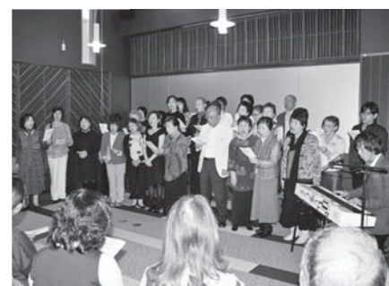
「元気の出る朗読の会」の皆さんが勢揃い