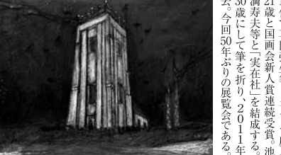
『鶴の舞う風景』1954年 油彩、キャンバス