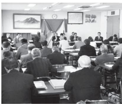
3月25日町役場2階の第3・4会議室で開かれた、立候補予定者説明会

定員16名 / 立候補予定者は22名 (4月14日現在) 現職10名、新人12名 後援会・事務所リスト