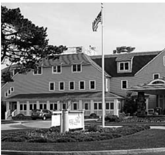
今日はお客様4人と朝の散歩をしながらInn by the Seaの朝食を食べにやってきました。こちらのクラブケーキとアボカドの使われたエッグベネディクトは最高です。