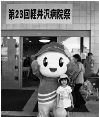
第23回軽井沢病院祭