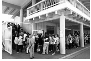
千円券/12枚綴り(1万2千円分)を1セット1万円で販売、1人3セットまで。発行数は5千セット/11月30日まで町内各取扱店で使用できます。今後は、軽井沢商工会館0267・45・5307で販売中。

梅雨晴れの晴天に恵まれた「軽井沢プレミアム商品券」発売初日、中央公民館では、7時から10人ほど並び始め、30分過ぎには50～60人、9時5分前には約400人の皆さんが行列を作りました(以上商工会関係者のカウント)。