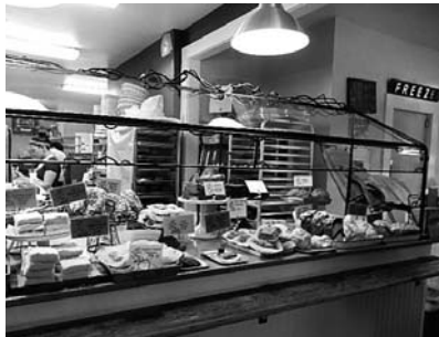
私達もベーグルのサンドイッチとコーヒーを買って帰りました。味も食感も本当においしい、こちらのコーヒーは、キャボットコーヴと同じ豆を使っています。