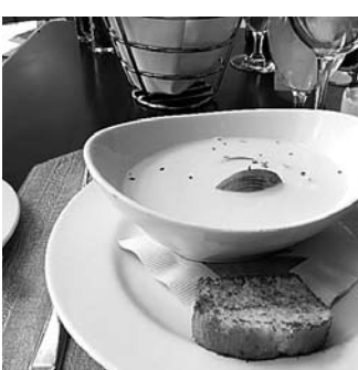
一番の楽しみはおいしいシーフードを食べること。まずはハーバーホテル内にある有名シェフダニエル・ブルース氏の「Rowes Wharf Sea Grille」のクラムチャウダー。