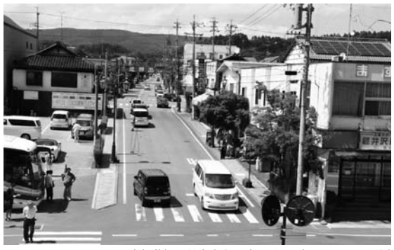
くつけテラスから見た中軽井沢駅前商店街: 地元がやる気になって...最近空き店舗2店がシャッターを開ける交渉も成立した...と土屋好生編集委員長

町が50年・100年先の「軽井沢グランドデザイン」を発表、くつけテラスを活かした伝統様式の中にモダンなセンス(和モダン)を提案していることも踏まえた。グランドデザインを受けた内容では町内初め環境条件を明らかにするSWOT(英