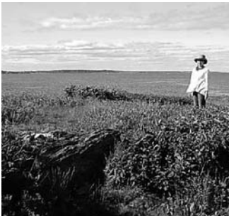
半島の先端にたどり着くと、見渡す限り大西洋の感動の風景が飛び込んできて、折りたたみ椅子を敷き、いつまでも海を眺めてゆったりとした時間を過ごします。

16年・交通大臣会合 サミットが軽井沢に 軽井沢 町の話題 いろいろ ■7月3日(金) 16時41分 軽井沢町メール配信サービス「こうほうかるいざわ」に、速報が流れた。 本日(7月3日)、2016年主要国首脳会議、伊勢志摩サミットに合わせ開催される関係閣僚会合のうち、交通大臣会合の軽井沢開催が決定いたしました。世界水準のリゾート会議都市に向けた第一歩を踏み出すことが出来たので、今後は、国や県と連携しながら開催に向けて準備を整え、万全の態勢を整えていきたいと考えております。開催時期等につきましては、国が中心となつて今後調整されることとなりますが、交通大臣会合の成功に向け、引き続き皆様のご理解とご支援をよろしくお願いいたします。企画課企画係