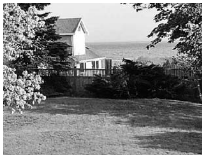
メイン州では今年もケープエリザベスの家を借りて滞在しています。外食するわずらわしさがなく、多くの友達を気兼ねなく招くことができる便利さもあって、3年目。

④ メイン州ポートランド市郊外の町の一角に、「Scratch Baking Co.」という大人気のベーグルを売っている小さなベーカリーがあります。 ⑤ レンタルハウスの前から道を渡ると海まで通じるトレイルがあり、野生のシカや七面鳥、たくさん種類の鳥たちとも会うことができます。