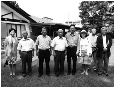
講演会を終わって、友愛山荘の広場で交流会。鳩山ご夫妻を中心に区長会のメンバーとの記念撮影がなごやかに