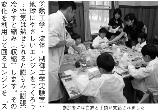
参加者には白衣と手袋が支給されました

普段は理工系学生の実験サポート をしている先生たちが町内3小学校 の児童約百名を指導してくれました ①先端生命科学センター…天然の デザインを楽しもう!葉脈をつかっ たしおりづくり:植物の葉っぱを観 察すると葉っぱの中にレースのよう なきれいな網目のすじが通っている のが見えます。このすじは葉脈と言 って、葉っぱのすみずみにお水や栄 養を届ける役割をしています。この 葉脈を葉っぱからとりだし、色をつ けたりかざりをつけたりして、世界 に一つしかない自分だけのしおりを 作ってみましょう。(小1〜3年)