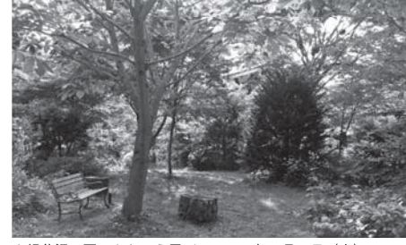
★軽井沢・夏のあとりえ展/2015年8月1日(土)~15日(土) 11時~18時(8日休み/15日15時まで) @あとりえアールグレイ (P・シルバーストーン隣り)