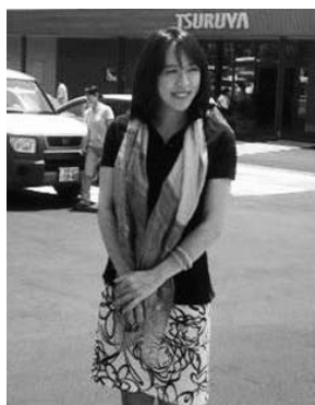
ラブジャパンブランド オープンショールーム/北佐久郡軽井沢町長倉2913-5軽井沢ハウス101(中軽井沢駅南口から3分、湯川沿い) TEL:0267-45-3719