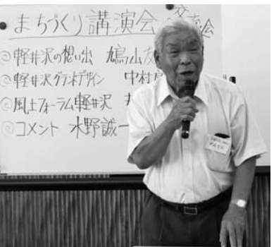
来年の交通大臣サミットでは、区長会が中心となって、町内の道路をキレイに、花を植えて、おもてなしを...