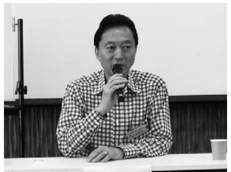
きょうだい3人がゼンソク持ちで、軽井沢にくるとそれが不思議と治まり、人生の楽しい思い出は軽井沢だけ?