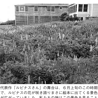
代表作「ルピナスさん」の舞台は、6月上旬のこの時期で、ルピナスの花が咲き誇りまさに絵本に出てくる景色が広がっていました。私たちの旅はこの景色を見ること。

⑩ Portlandから北へ、森や湖の風景の中を車で走ると1時間30分程でCantonという小さな町にたどり着きます。ご夫妻はこの町で農業と、冬はメープルシロップの生産。