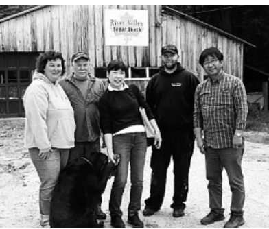
ポートランドから北へ、森や湖の風景の中を車で走ると1時間30分程でCantonという小さな町にたどり着きます。ご夫妻はこの町で農業と、冬はメープルシロップの生産。

⑨ Danarscottiaからさらに海岸線を車で1時間、Fookandにはフアリンズワイス美術館IIアンドリュウ・ワイエス親子・最大のコレクションが。 ⑩ Portlandから北へ、森や湖の風景の中を車で走ると1時間30分程でCantonという小さな町にたどり着きます。ご夫妻はこの町で農業と、冬はメープルシロップの生産。