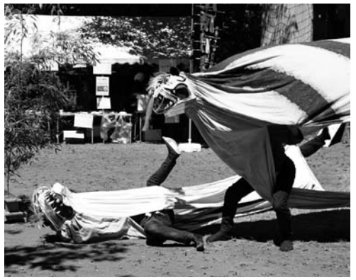
過去最高の約二千人の人数で追分 宿は一日中大賑わい。7月26日、「第 30回しなの追分馬子唄道中」が開か れ、軽井沢町が東日本大震災後の復 興支援事業を続ける若手県大榎町 から伝統芸能「虎舞」が参加し、ダイ ナミックな演舞を披露した(写真)。

7月26日(日) @追分宿&周辺等 大榎町「虎舞」に感動の輪、第30回 しなの追分馬子唄道中(荻原里一実 行委員長)を開催。