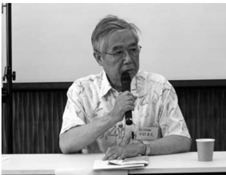
Grand Designの基本は、冊子の3~4Pに語り尽くされています。発地では、馬も景色の一部に見えますね