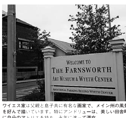
ワイエス家は父親と息子共に有名な画家で、メイン州の風景を好んで描いています。特にアンドリュウは、美しい田舎町に自分のアトリエを持ち、永年に渡って滞在。

⑩ Portlandから北へ、森や湖の風景の中を車で走ると1時間30分程でCantonという小さな町にたどり着きます。ご夫妻はこの町で農業と、冬はメープルシロップの生産。