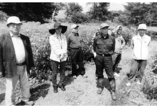
最近、来年の大河ドラマ「真田丸」の話題が多くなりましたが、1月10日に始まる第1話冒頭の「真田幸村と矢沢三郎が偵察している」というシーンを9月1日と2日にかけて、この「せせらぎの小径」を使って撮影しました。

最近、来年の大河ドラマ「真田丸」の話題が多くなりましたが、1月10日に始まる第1話冒頭の「真田幸村と矢沢三郎が偵察している」というシーンを9月1日と2日にかけて、この「せせらぎの小径」を使って撮影しました。(文:土屋正治:090-7810-8214)