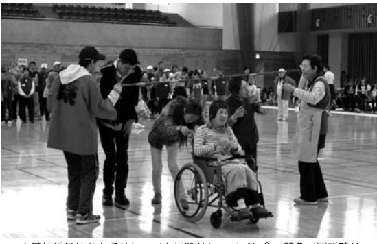
★競技種目はむかでリレー/お掃除リレー/パン食い競争/関所破りリレーなどが行われ、競技が熱くなるたびに会場に歓声があがった