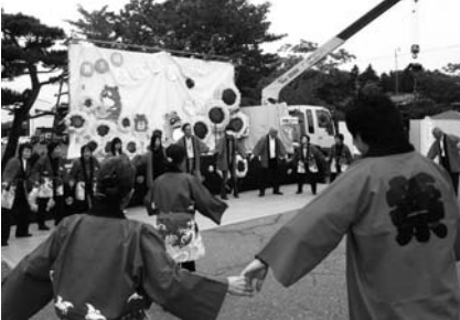
★スタンプラリー/大ピンゴ大会/ミニSL/白バイ・バトカー試乗/綿あめポップコーン/豚汁&いなり寿司など