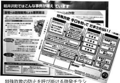
軽井沢町ではこんな事例が増えていきます