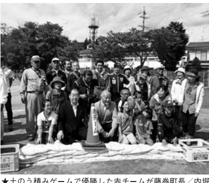
★土のう積みゲームで優勝した赤チームが藤巻町長/内堀議長と記念撮影。美しく理にかなった積み方も評価された