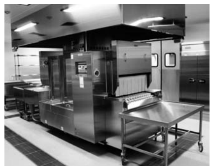
「自校方式の給食調理室」と「屋内運動場のコート」