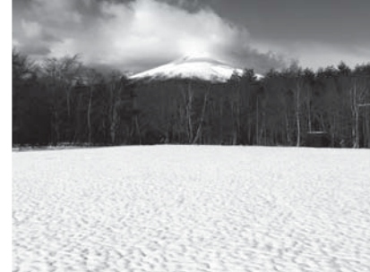
夏はキャンプや川遊びに、冬はソリ遊びにと、季節を問わず子どもたちの元気な声がこだまするフィールド