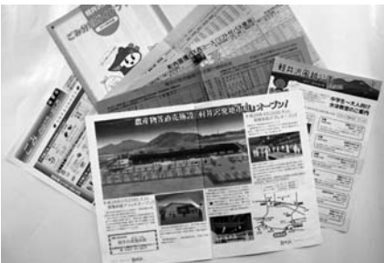
連絡先：観光経済課 0267・46・3165

オアシス。スカップ軽井沢のプールは中学生～大人向け水泳教室案内の「軽井沢風越公園 News」(4月)を入手したい。