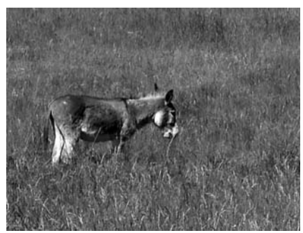
南仏の雄大な敷地で美味しそうに牧草を頬張るロバ君。連日のアンティークハンティングの疲れを忘れさせてくれる、ゆったりとした癒しの時間が流れます。