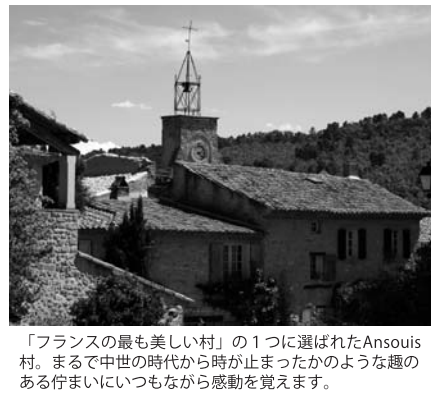
「フランスの最も美しい村」の1つに選ばれたAnsois村。まるで中世の時代から時間が止まったかのような趣のある佇まいにいつもながら感動を覚えます。