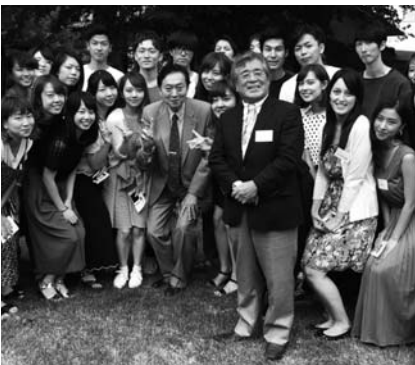
スタッフに囲まれる鳩山氏と松平氏

冒頭、FIACS会長・鳩山由紀夫氏(元内閣総理大臣)は、雲場池を含めた一帯を鳩山家(石橋家)が