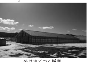
外は凍てつく厳寒