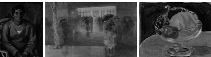
松下展 松下春雄「雄像」 新規収蔵品展 牧野義雄「雨のスローン広場」 作者不詳展 梅原龍三郎「メロン」

ふれあい館 開催 【東信濃の工芸作家展 2月15日~2月28日】 【燦々会展 3月2日~14日】 【みまき絵画会展 3月16日~3月29日】