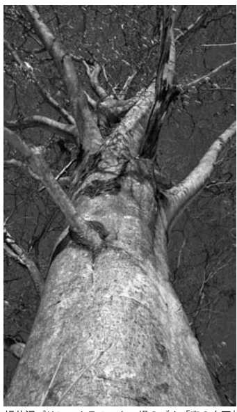
軽井沢プリンスホテルスキー場のブナ「森の女王」