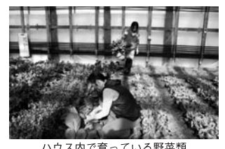
ハウス内で育てている野菜類