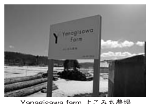
Yanagisawa farm よこみち農場