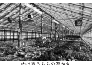
内は春うららの温かさ