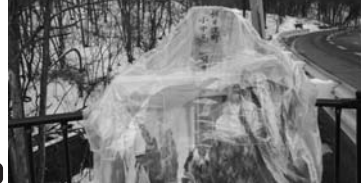
U 軽井沢町役場の職員が、千羽鶴を手にして、石碑の内容を検討する考えだ。生徒らは、その場所に持参の千羽鶴を。

「軽井沢スキーバス転落事件被害者遺族の会」は、昨年12月下旬、現場近くに遺族有志が建立を望む慰霊の石碑について、国土交通省側から設置場所の提示があったことを明らかにしており、今春の着工を目指し、石碑の内容を検討する考えだ。生徒らは、その場所に持参の千羽鶴を。