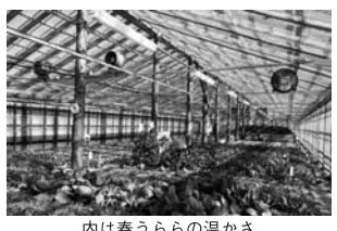
内は春うらの温かさ