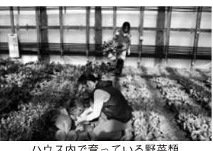
ハウス内で育っている野菜類