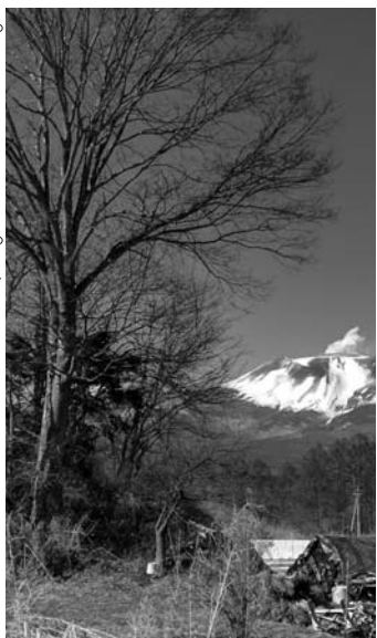
浅間山を遠望する下発地の流れ山のケヤキ

ケヤキは川岸などの岩場に自生しますが、よく目にするのは公園や街路樹として植えられているケヤキです。