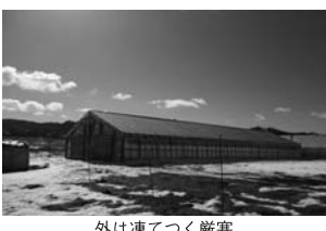
外は凍てつく厳寒